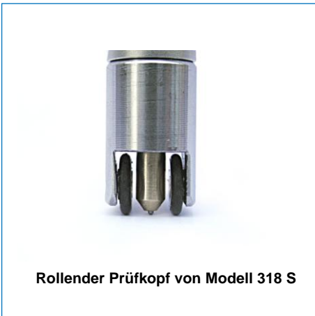
Rollender Prüfkopf von Modell 318 S