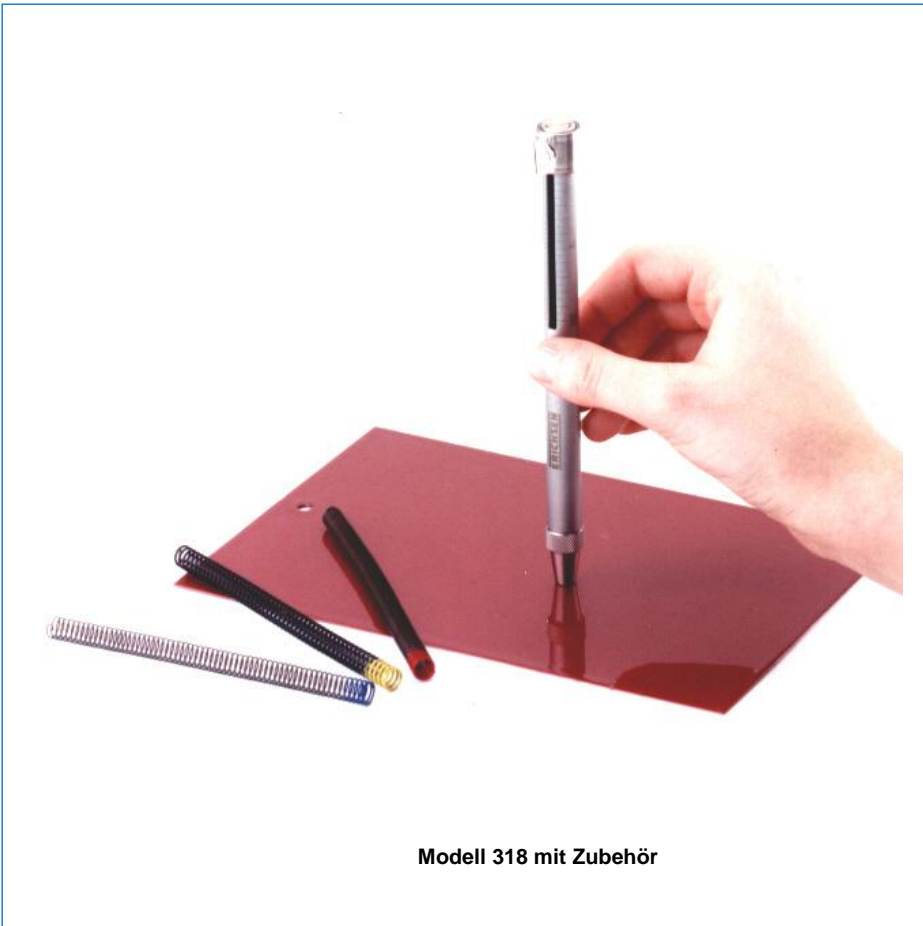
Modell 318 mit Zubehör

testing equipment for quality management