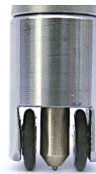
Abb. Prüfkopf rollend - Modell 318 S

Das Kopfstück ist mit zwei kleinen, gummibereiften Führungsrädern ausgestattet. So ist sichergestellt, dass auch bei unbeabsichtigt viel zu hohem Andruck des Stabes durch den Anwender, ausschließlich die verwendete Prüfspitze ggf. eine Spur auf der zu prüfenden Oberfläche hinterlässt.