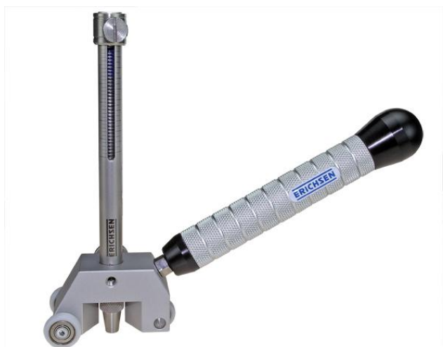
Abb. Modell 318 C mit Einspann-Adapter und Griff

Hier sorgen die drei Polyamidräder für die entsprechende Stabilität beim senkrechten Aufsetzen sowie der Führung.