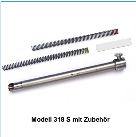
Modell 318 S mit Zubehör