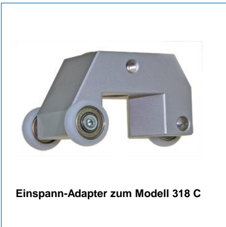
Einspann-Adapter zum Modell 318 C